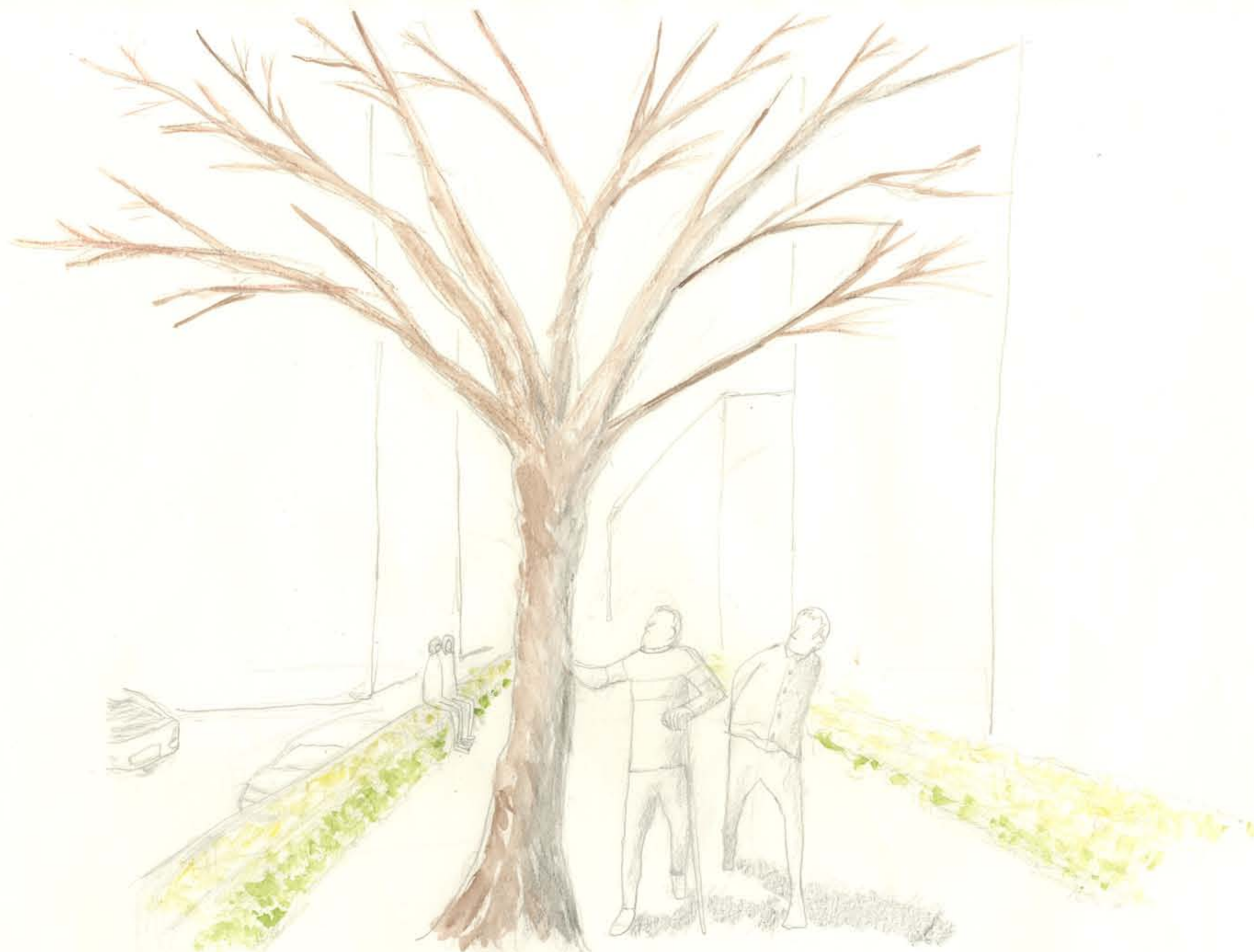
3 歩道レベルを高くすることで、安全で落ち着いた空間に。